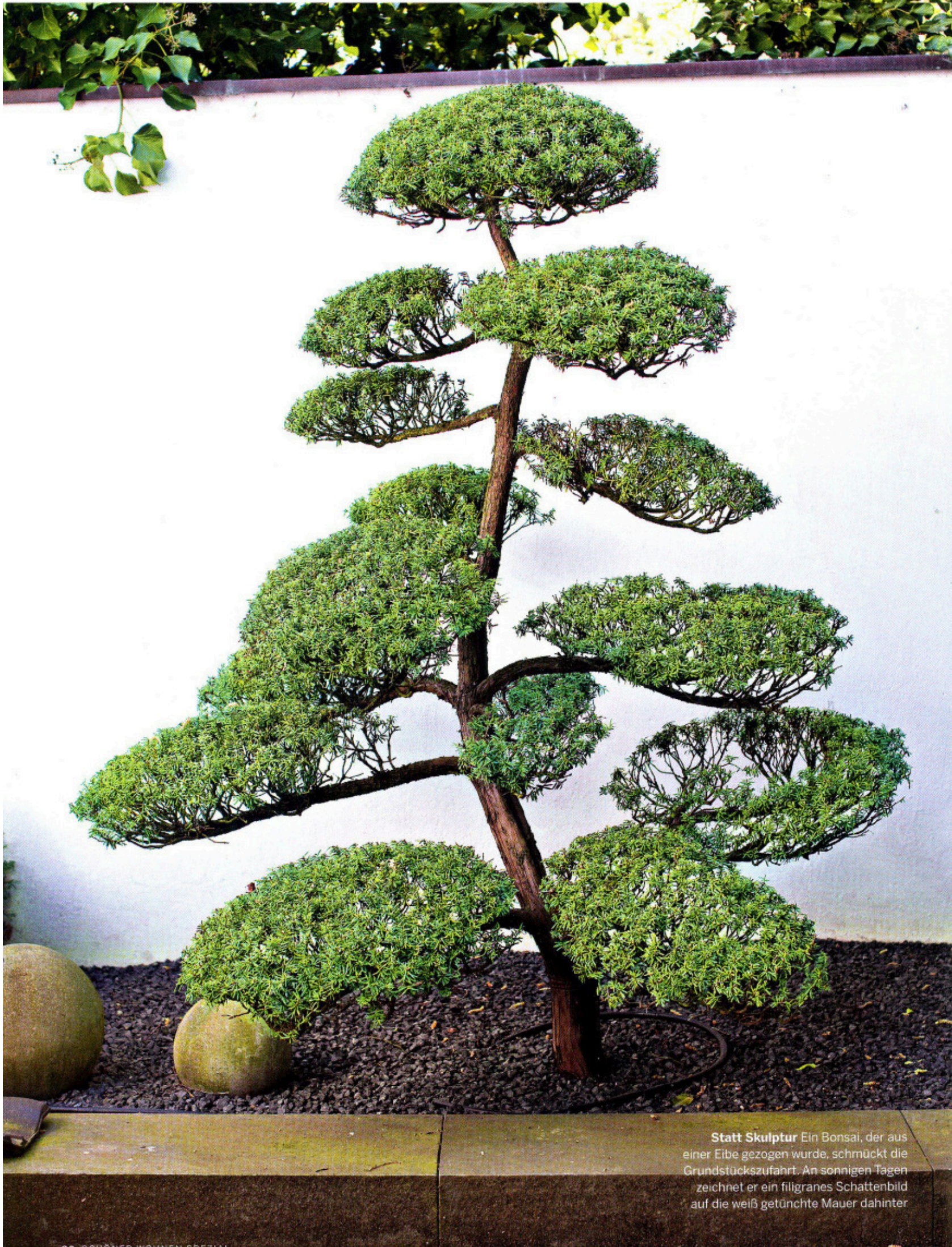
Statt Skulptur Ein Bonsai, der aus einer Eibe gezogen wurde, schmückt die Grundstückszufahrt. An sonnigen Tagen zeichnet er ein filigranes Schattenbild auf die weiß getünchte Mauer dahinter