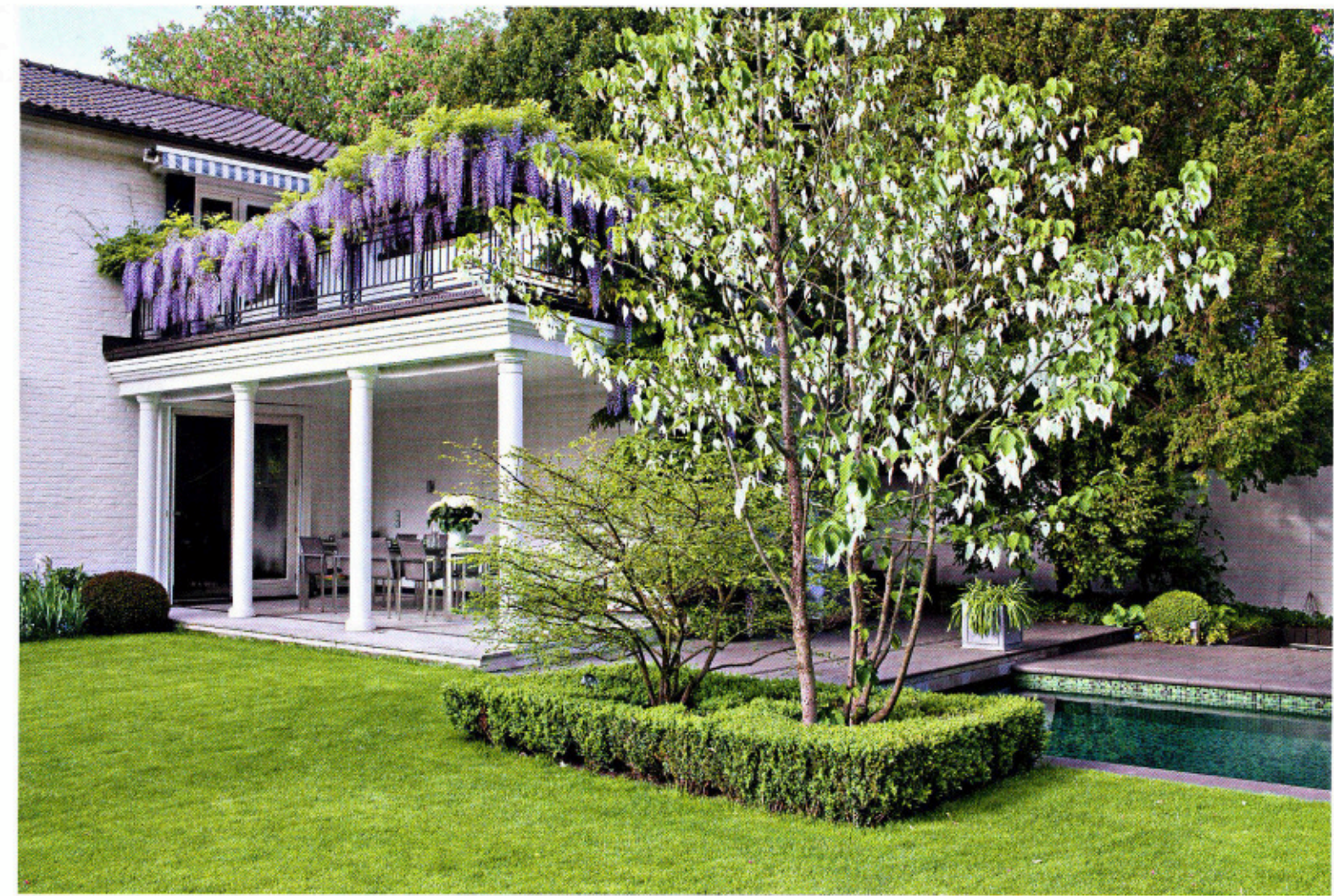
Akzent Über der Terrasse zieht eine violett blühende Wisteria den Blick auf sich. Im Beet davor winkt ein Taschentuchbaum Wassertisch Rundherum blühen im Laufe des Jahres Christrosen, Zierlauch, Storchschnabel, Anemonen – alle in Weiß

„Weiße Blüten leuchten in der Dämmerung – das liebe ich ganz besonders an ihnen“ Gartenarchitektin Brigitte Röde